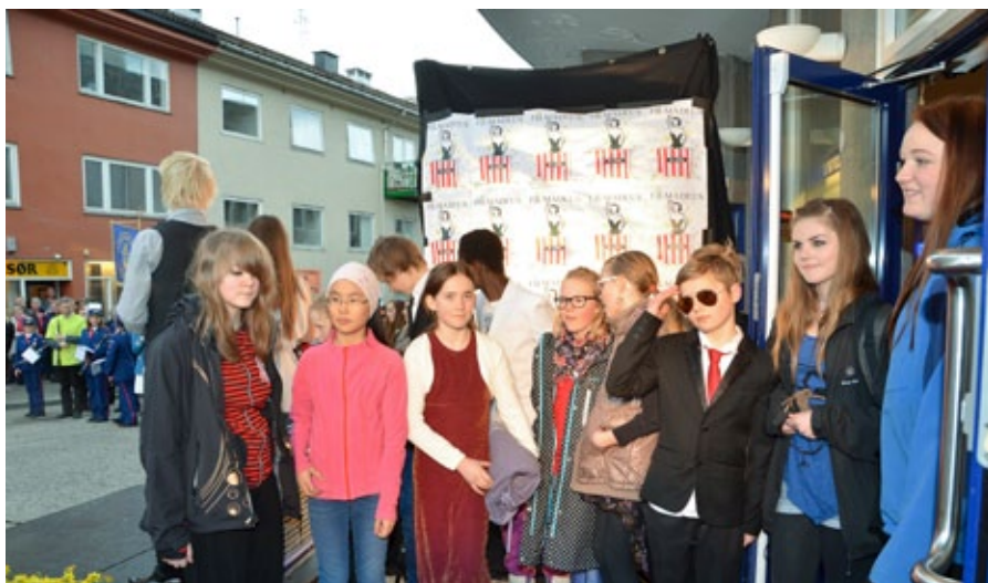
fotovegg: Egen fotovegg må jo en ekte filmfestival også ha.