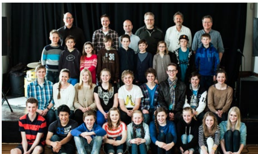
på seminar: Noen av deltakerne og instruktører på jazzseminaret i Hamar.