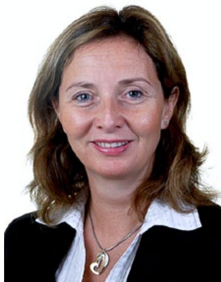
har levert innstilling: Gunn Karin Gjul (Ap) leder Stortingets familie- og kulturkomité.