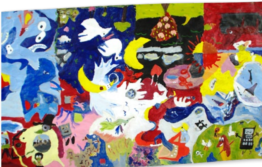
inspirert: Kunst laget av visuell kunst- elever med utgangspunkt i tekstene. De leide inn kunstneren Børje Sundbakken til å inspirere dem.

tekst: egil hofslie foto: kjersti sandvik