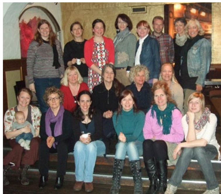
samling i oslo: Teaterpedagoger samlet ved Oslo Nye.