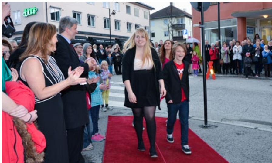
på rød løper: Filmadeus hadde selvsagt rød løper å by sine filmstjerner.