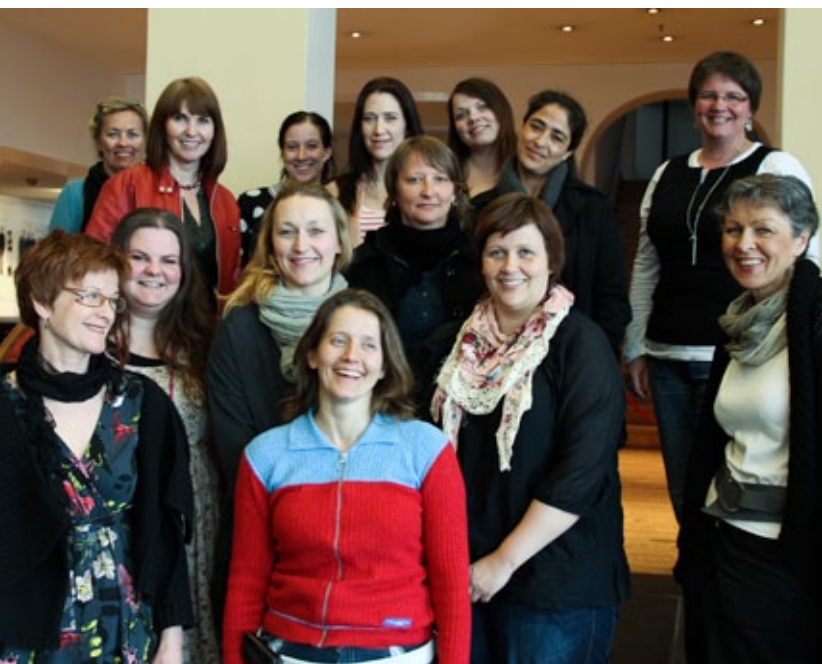
samling i trondheim: Teaterpedagoger samlet ved Trøndelag Teater.