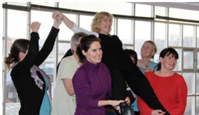
godt mottatt: God danseglede og stor læreiver på Ut på golvet-kursene i vår.