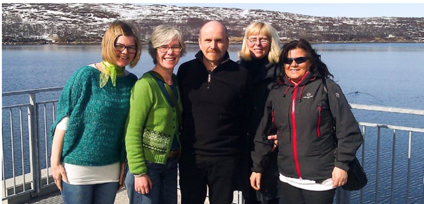
nettverksglød: Kunstpedagoger i Finnmark glødet da de i Kirkenes fikk innblikk i hva et regionalt fagnettverk kan bety for dem.